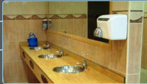
ENCIMERAS FENÓLICAS PHENOLIC TOPS